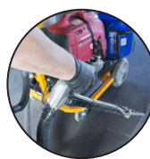
Una persona Operación

El nuevo e innovador diseño de la bomba de polímero de USSAWS permite que una persona controle la posición de la bomba con una mano mientras dispensa el relleno de juntas con la otra. La operación con la mano izquierda y derecha es fácil con el mango en "T" de doble cara. Esta "bomba de un solo hombre" permite que otros trabajadores se encarguen de otras tareas mientras una persona llena las juntas.