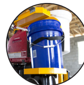
Cubo de residuos Poseedor