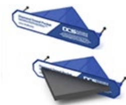
DIAMOND DOWEL SYSTEM DCS