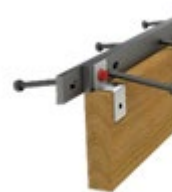
PROTECCIÓN DE JUNTAS ARMOURSTRIP