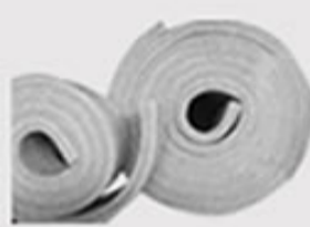
BANDAS DE DILATACIÓN