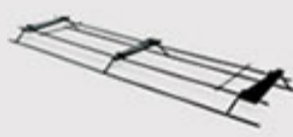
DURABLE CONCRETE SOLUTIONS PD3 BASKET