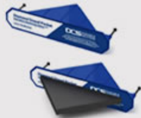
DIAMOND DOWEL SYSTEM DCS

Descubre más de nuestros productos utilizados en estos proyectos y algunos de sus relacionados