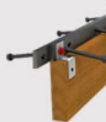
PROTECCIÓN DE JUNTAS ARMOURSTRIP