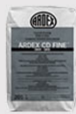
ARDEX CD FINE